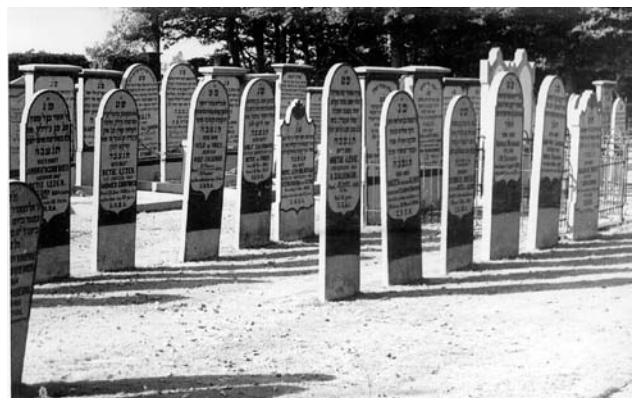
Sfeerimpressie van de joodse begraafplaats.