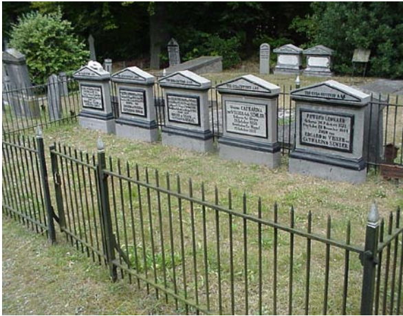
Familiegraf De Visser: uniformiteit in vormgeving, goed onderhouden, hetgeen ook geldt voor het gietijzeren hekwerk (hortus conclusus). Dat laatste is haast een zeldzaamheid geworden.