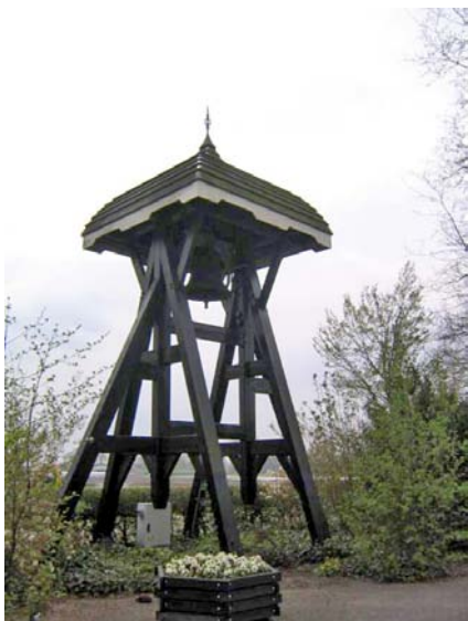
De klokkenstoel bij de toegang tot de Algemene Begraafplaats van Nijeveen.