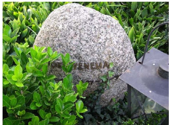
Pas de afgelopen decennia is er weer ruimte voor een individuele expressie in grafmonumenten, zoals in de keuze voor afwijkende materialen en vormen, alsook toevoegingen aan het graf zoals beplanting en objecten zoals lantaarns.