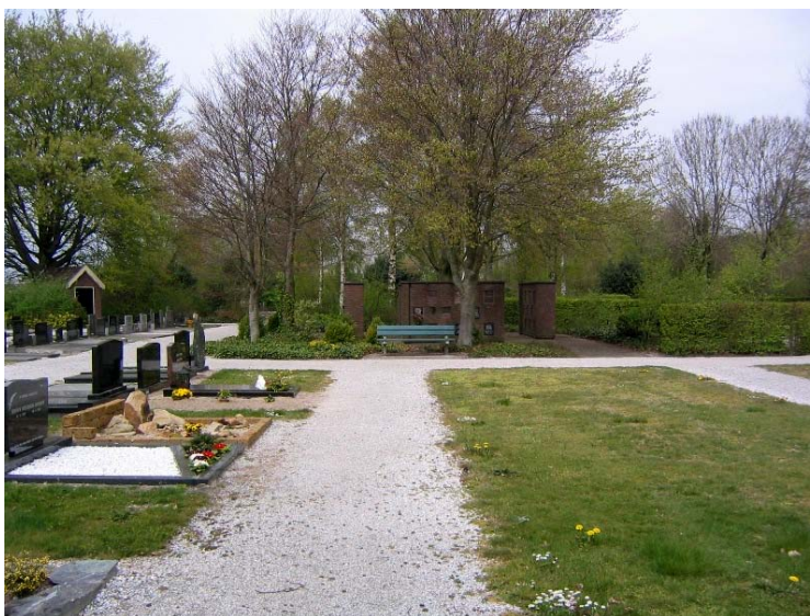
Overzicht van de Algemene Begraafplaats van Nijeveen, met in het midden van de foto de urnenmuur.