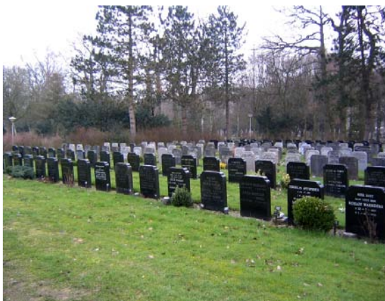
tonen de uitbreidingen uit de jaren 1960 en 1970 een monotone uniformiteit door de regels die destijds werden gesteld aan de vorm van grafmonument.