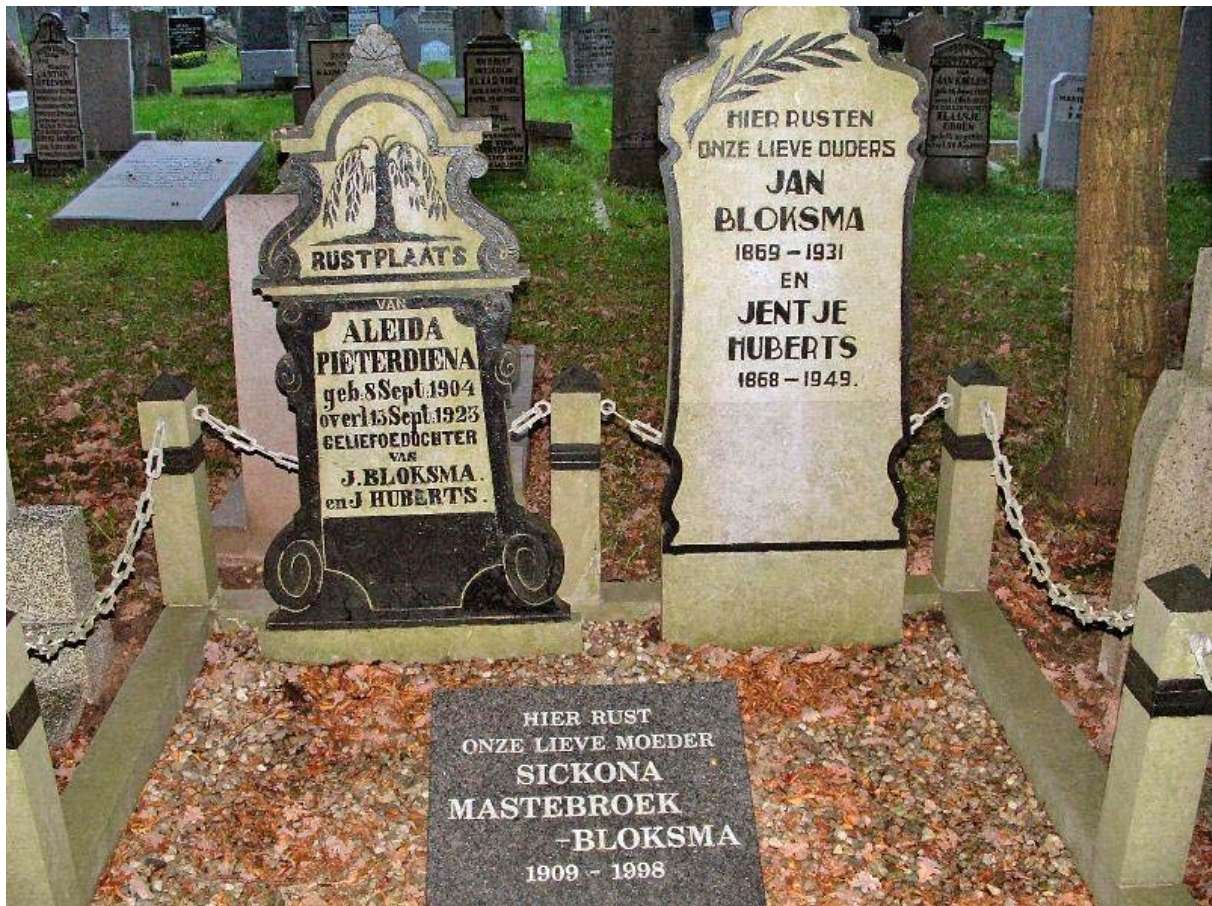
Waar de oudere delen veel variatie kennen, zelfs binnen één familiegraf,