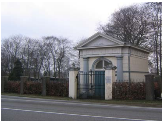
Toegang van de joodse begraafplaats.

Foto's van de zerken en vertalingen van de opschriften worden bewaard in het Historisch Centrum Overijssel in Zwolle. Het begrafenisregister over de jaren 1856-1942 is aanwezig in het Joods Historisch Museum te Amsterdam.