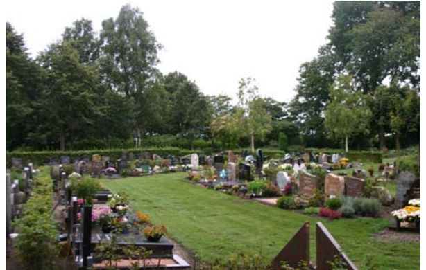
Nieuwere gedeelten van de Algemene Begraafplaats Meppel.